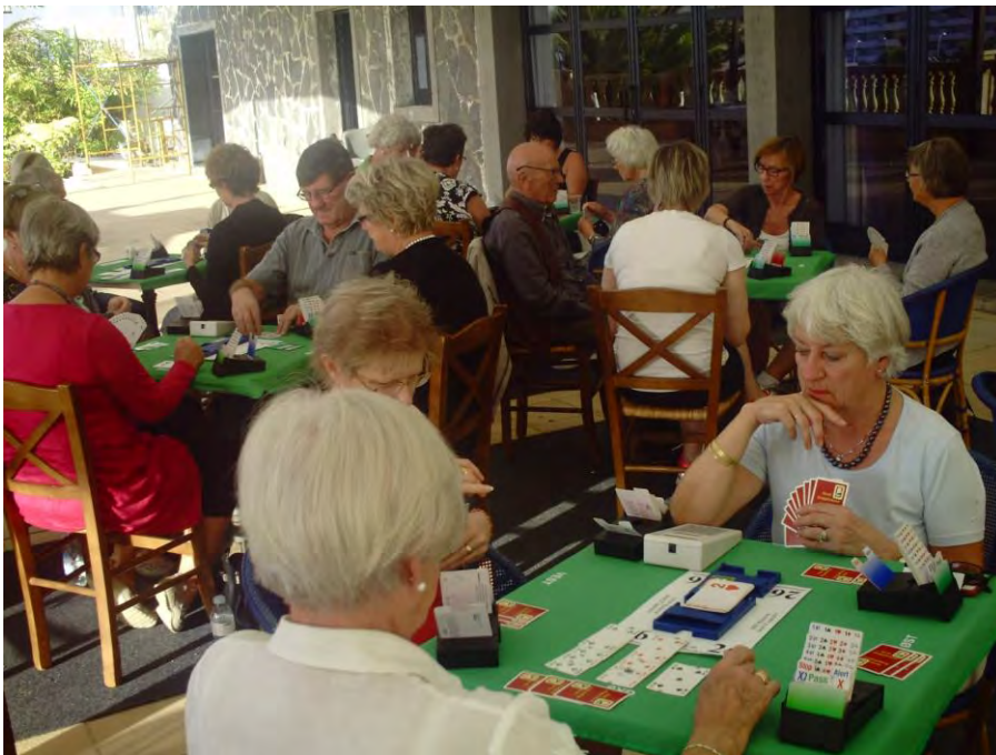
Her fra spillingen i teltet utenfor Atlante i 2014.

Start for både undervisning og turneringsaktiviteter blir mandag 16. november. Hver dag (ikke søndag 22.) fra kl.16.00 til ca kl.19.00 er det undervisning med teori og mye spilling.