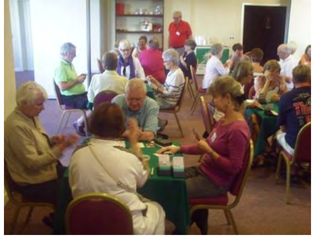
og dyp konsentrasjon i spillet.