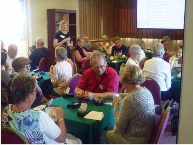
Både koselig prat ved bordet